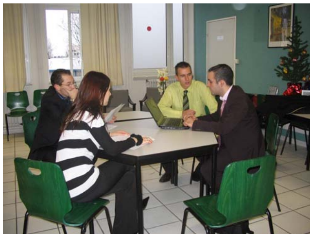
Le Président de l'association avec son bureau